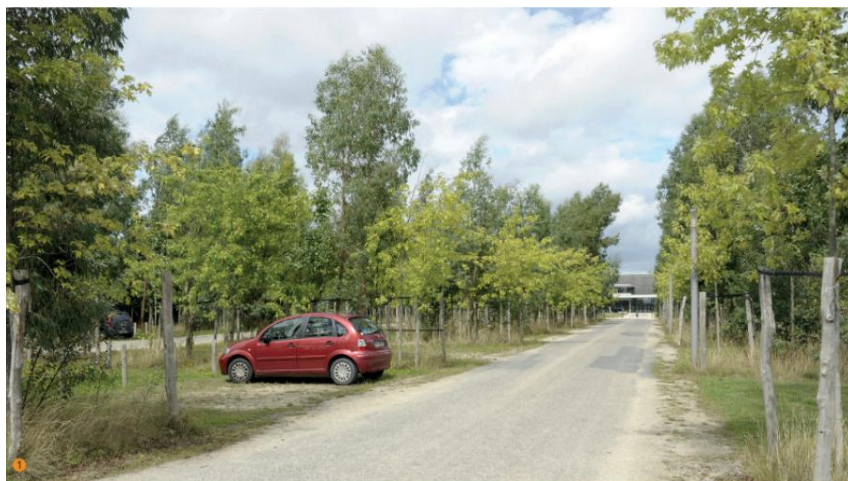
Exemple de parking – Dossier PLUi